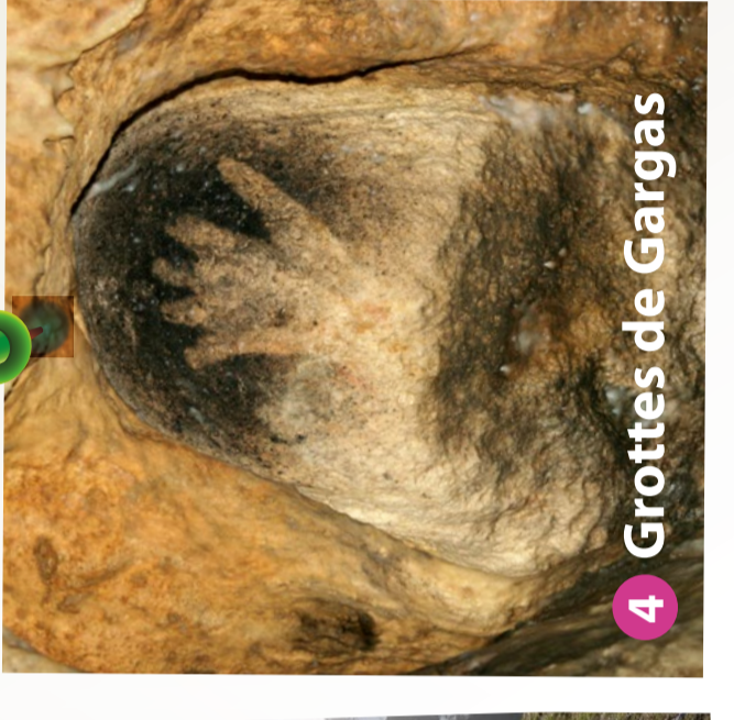
4 Grottes de Gargas