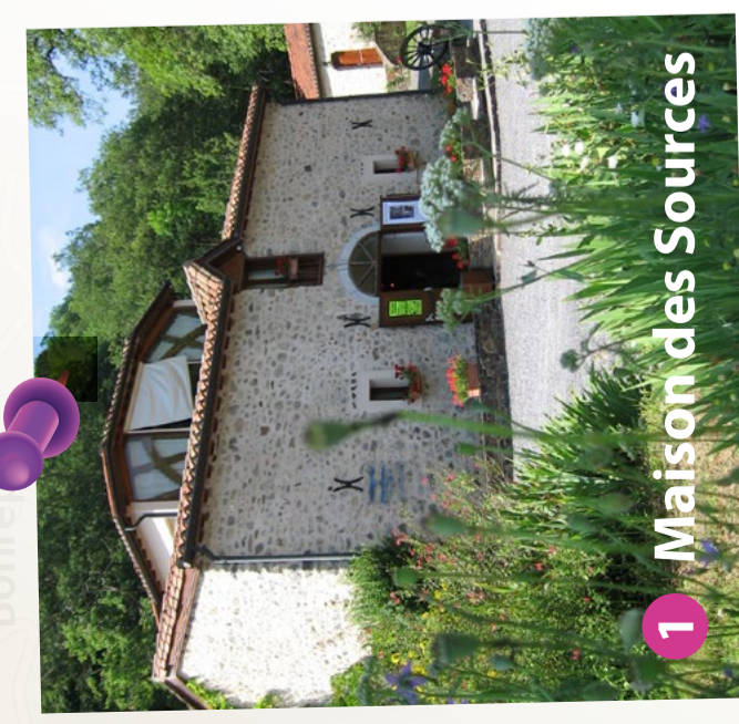
1 Maison des Sources