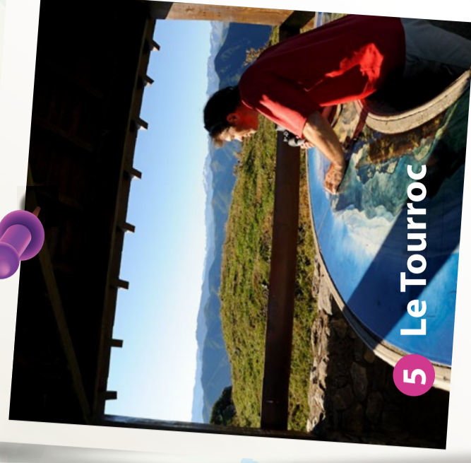
5 Le Tourroc